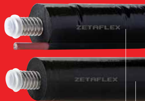
Monotubo con cavo sensore. Single-pipe with sensor cable.

Black smooth polyolefin copolymer outer film featuring high mechanical strength, and resistance to weathering and UV rays. 4-5 wire sensor cable.